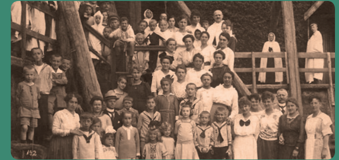
Leipziger Kindererholung im Solbad Dürrenberg 1919

EnterHistory! sucht Dich – mach online Geschichte!